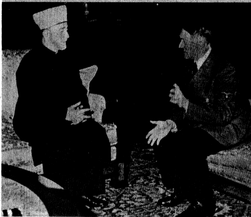
Le Fâhrer s'entretient cordialement avec le grand mufti.

דער מופטי, דער אמתער שוף פון טאטארן-לעניאן און פון אלע מוסולמאנישע אפטיילונגען פון עס. עס. דאס בילד איז פון 1942 אין בערסטעסגאדען.